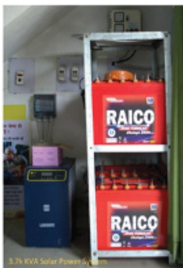
सोलर पीवी प्रणाली के लिये बैटरी बैंक अप।

उस दौरान, सिर्फ डीजल जेनरेटर का ही सहारा था, लेकिन इसे चलाकर काम करना भी किसी चुनौती से कम नहीं था। महिला कर्मचारियों के लिये डीजल जेनरेटर चलाना बहुत मुश्किल था, साथ ही इससे काफी ज्यादा वायु और ध्वनि प्रदूषण भी होता था। जेनरेटर चलाने के लिये डीजल लेने के लिये सबसे नजदीकी फ्यूल स्टेशन तक पहुंचने में भी डेढ़ घंटे का वक्त लगता है।