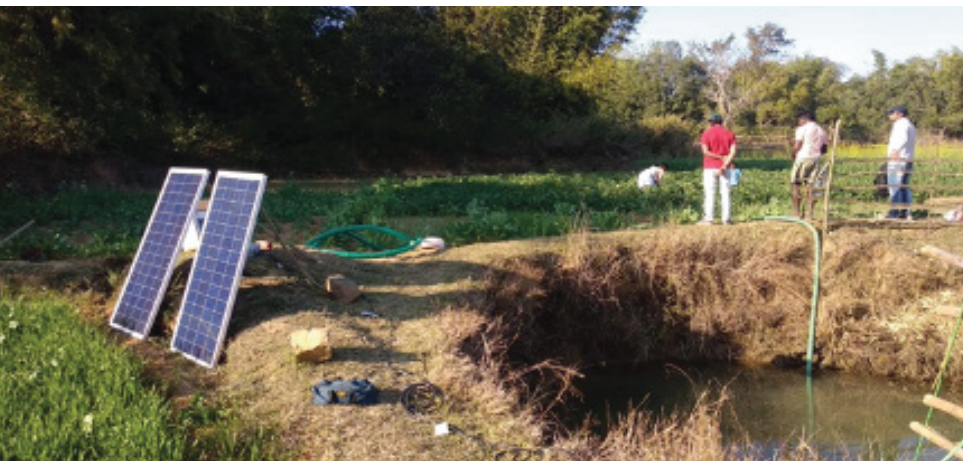
एक पोर्टेबल सौर संचालित पंप।

सौर ऊर्जा चालित व्यक्तिगत सिंचाई पंप जो लाने/ले जाने में आसान और साल भर खेती करने के लिये सिंचाई सुनिश्चित करे