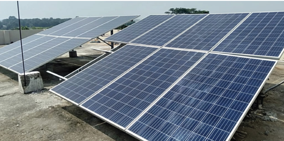
खूँटी जिले के परेका गांव स्थित लीड्स रिसोर्स सेंटर में लगी 5 किलोवॉट सौर ऊर्जा प्रणाली। 2020/ खूँटी, झारखण्ड

स्वच्छ ऊर्जा का मतलब झारखण्ड में सौर/अक्षय ऊर्जा को बढ़ावा देने और उसे अपनाने से है।