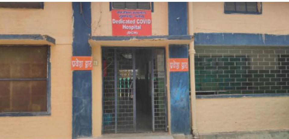
नव जीवन अस्पताल, पलामू जिला, झारखंड की राजधानी रांची से 120 किलोमीटर दूर।

कोविड-19 महामारी के इस दौर में भारत की स्वास्थ्य सेवाओं पर बहुत दबाव है। ऐसे में झारखंड की राजधानी रांची से 120 किलोमीटर दूर पलामू में स्थित नव जीवन अस्पताल एक मिशाल के रूप में उभरा है। झारखंड के दूरदराज इलाकों में बेहतरीन चिकित्सा सुविधाएं बहुत कम और दूर हैं। खासकर पलामू और लातेहर जिलों में। पलामू में नव जीवन अस्पताल की स्थापना वर्ष 1961 में की गयी थी। इस अस्पताल में एक लम्बे अर्से तक प्रसव और सर्जरी का काम फ्लैशलाइट और पेट्रोमैक्स की रोशनी में जाता था। हालांकि ग्रिड से तीन फेज का बिजली कनेक्शन मिलने के बाद हालत कुछ तो सुधरी लेकिन बिजली कटौती और वोल्टेज में लगातार उतार-चढ़ाव की वजह से अस्पताल के कामकाज और स्वास्थ्य सुविधायें बाधित होती थी।