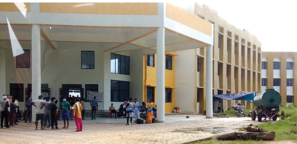
एक शिक्षण संस्थान, जिसे क्वार्टीन सेंटर बनाया गया।

कोविड-19 महामारी ने भारतीय स्वास्थ्य सेवाओं को चर्चा में ला दिया है। ऐसी आपात स्थितियों में प्रभावी ढंग से काम करने के लिये स्थानीय प्रशासन के पास जरूरी संसाधन मौजूद होना जरूरी है। बिजली भी एक ऐसा ही संसाधन है।