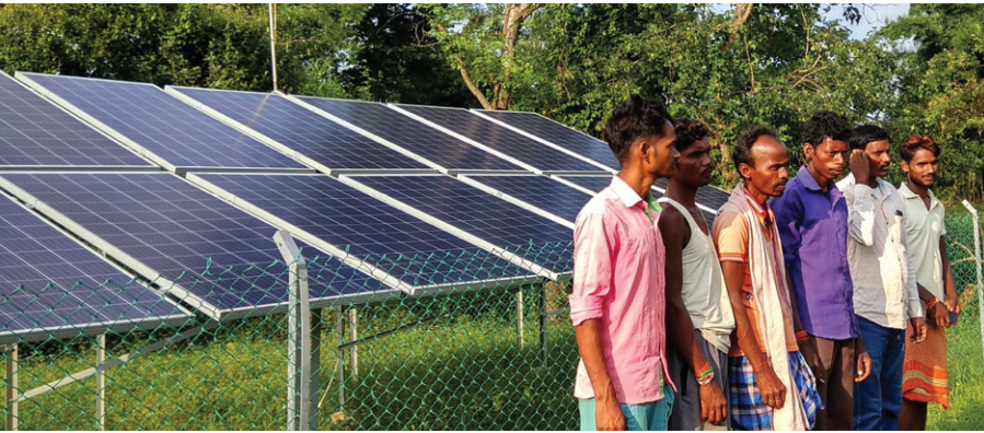
सौर ऊर्जा से सिंचाई।

सिंजेटा फाउंडेशन (एसएफआई) और ट्रांसफॉर्म रूरल इंडिया फाउंडेशन (टीआरआईएफ) ने झारखंड के चोकरबेड़ा गाँव में वर्षा जल पर निर्भर रहने वाले लघु किसानों को सौर ऊर्जा से चलने वाली बारहमासी सिंचाई सुविधा के रूप में एक समाधान दिया है।