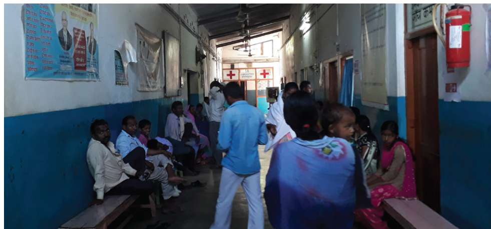
इंतजार कर रहे मरीज।

इस 100 बेड के अस्पताल में बिजली की बेहतर व्यवस्था सुनिश्चित करने के लिये यहां के एक डॉक्टर ने जनवरी 2020 में अपनी जेब से खर्च करके यहां 10 किलोवाट का पहला सौर फोटोवोल्टेक (पीवी) ऊर्जा सिस्टम लगावाया। उस वक्त अस्पताल टीम को अंदाजा नहीं था कि कोविड-19 महामारी का दौर बस एक ही महीना दूर है। मगर दूरदराज इलाके में होने के बावजूद यह अस्पताल किसी भी संकट से निपटने के लिये तैयार था।