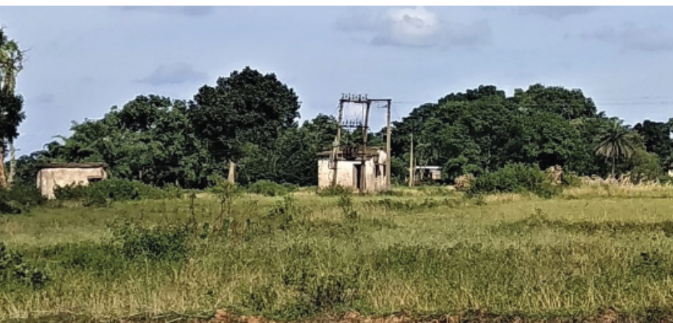
भालको द्वारा 1990 के दशक में लगाया गया लिफ्ट इरिगेशन सिस्टम।

विस्थापन की ज्यादा दर वाले राज्य झारखण्ड के पास सतत ऊर्जा संसाधनों के जरिये किसानों को सशक्त करने की बेहतर सम्भावनाएं हैं।