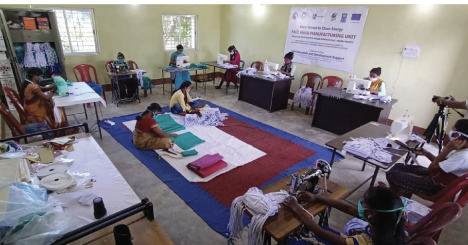
महिलाओं द्वारा मास्क और पुनः प्रयोज्य होने वाले सैनिटरी नैपकिन की सिलाई, लीड्स रिसोर्स सेंटर खूंटी

झारखण्ड के खूंटी जिले के पेरका गांव में स्थित लीड्स रिसोर्स सेंटर की स्थापना झारखण्ड अक्षय ऊर्जा विकास एजेंसी (जेआरईडीए), यूनाइटेड नेशंस डेवलपमेंट प्रोग्राम (यूएनडीपी) और आईसीसीओ ने की है। यह रूफटॉप सोलर सिस्टम से युक्त केन्द्र है, जो इस अनिश्चितता भरे मुश्किल वक्त में महिलाओं को रोजीरोटी दे रहा है।