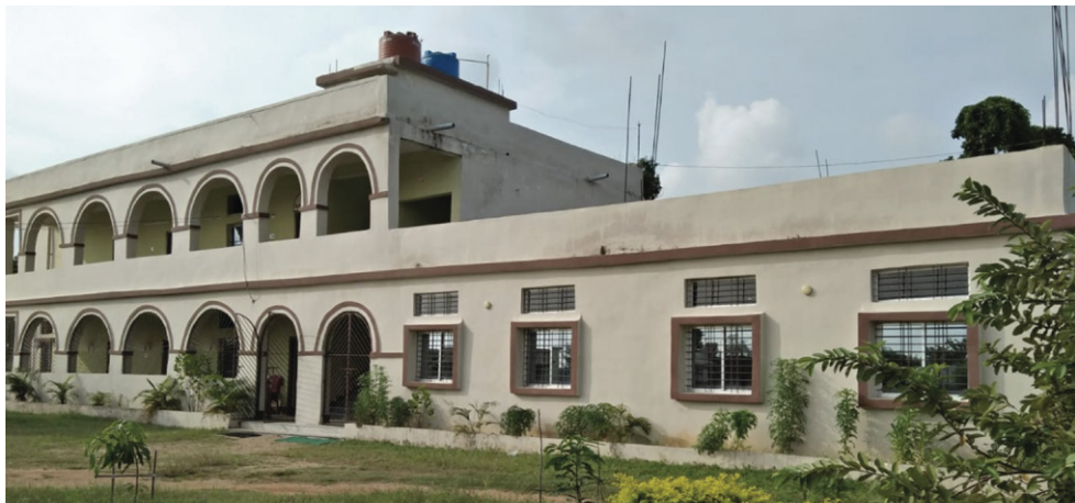
लीड्स रिसोर्स सेंटर खूटी

इन महिलाओं ने बार-बार इस्तेमाल करने योग्य सैनिटरी नैपकिन, मास्क, महिलाओं के कपड़े, बच्चों की यूनिफॉर्म और अनेक चीजें तैयार करके हर महीने औसतन 8000 रुपये कमाये हैं। अगस्त 2020 में महिलाओं की इस टीम ने 25000 मास्क तैयार किये हैं।